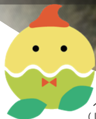
ぺぴキャベ (はれっぱキャラクター)