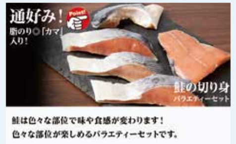
通好み! 断のり「カマ」 入り!