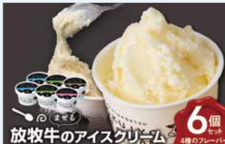
放牧牛のアイスクリーム