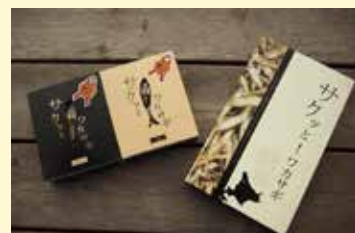
サクッと!ワカサギ