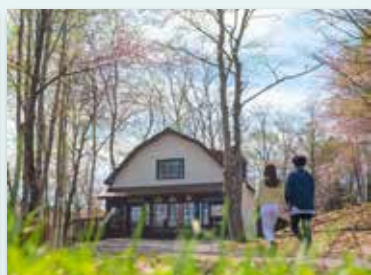
和寒町「塩狩峠記念館」