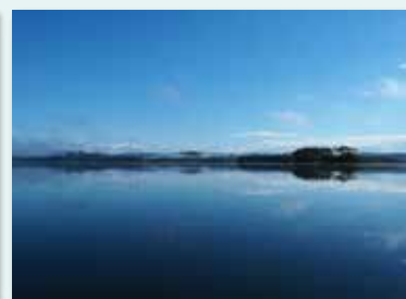
幌加内町「朱鞠内湖」