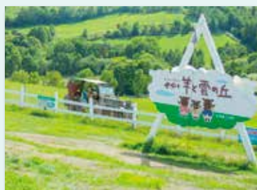
士別市「羊と雲の丘」