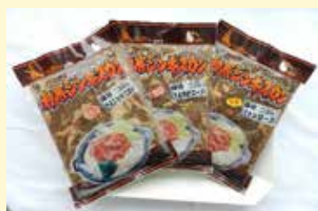
和寒ジンギスカン