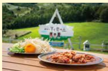
サフォークラムジンギスカン