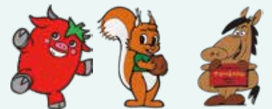
ビラッキー クルミちゃん とねっこくん

3/18~19は 平取町 日高町の特産品 を使ったメニューが ホテルポールスター札幌の レストランメニューに登場!