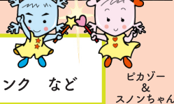
ピカゾー & スノンちゃん