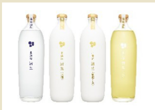
じゃがいも焼酎 北海道 清里