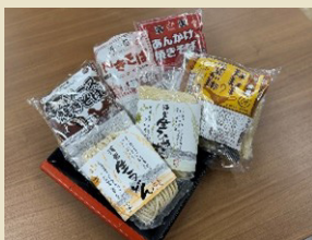
清里生うどん・生ひやむぎ・やきそば