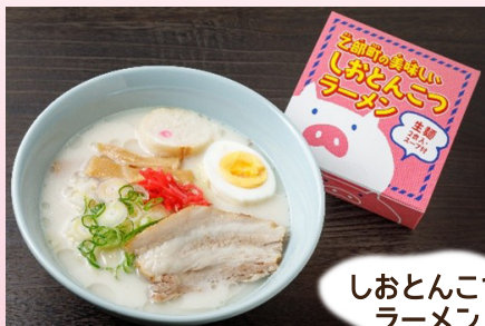
しおとんこつ ラーメン