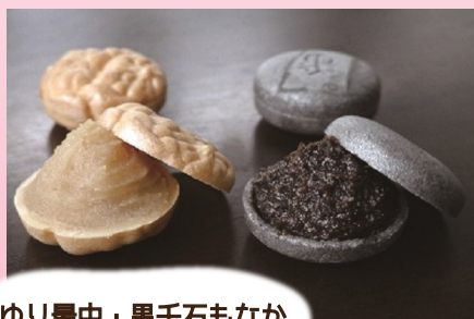
ゆり最中・黒千石もなか